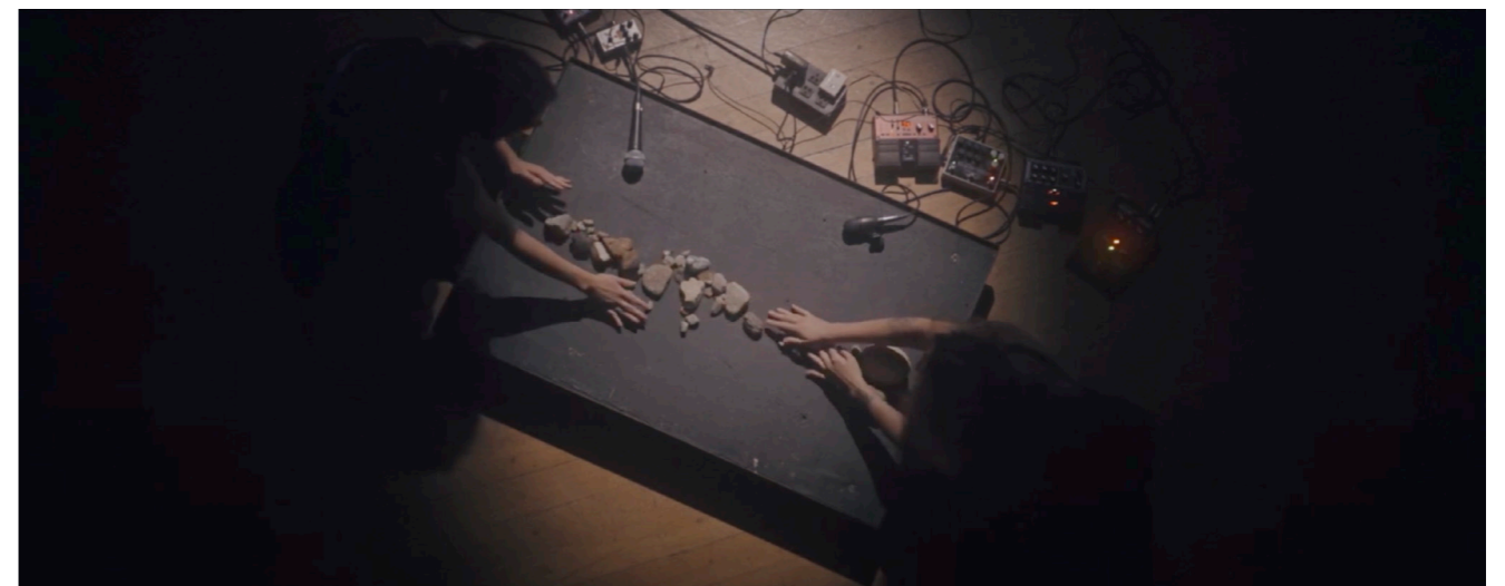
Fronte Violeta, Hush , 2022, still de la vidéo (18'25'/sound composition)